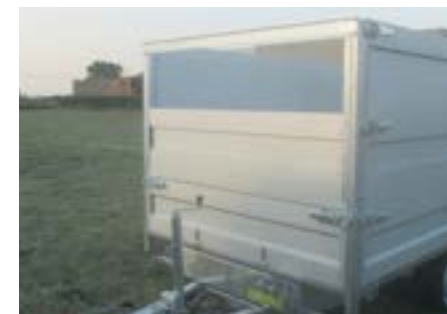
MODULA - Bordwandaufsatz: klappbare Vorderwand mit einschiebbarer Alu-Bordwand (H=50cm)