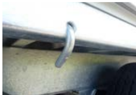
8 stabile Anbindehaken unter dem Fahrgestell geschweißt