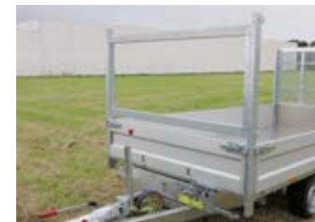
MODULA - Basis: klappbare Vorderwand, H-Gestell mit verstellbaren Querträgern