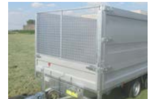
MODULA - Laubgitter: klappbare Vorderwand mit abnehmbarem Laubgitter.