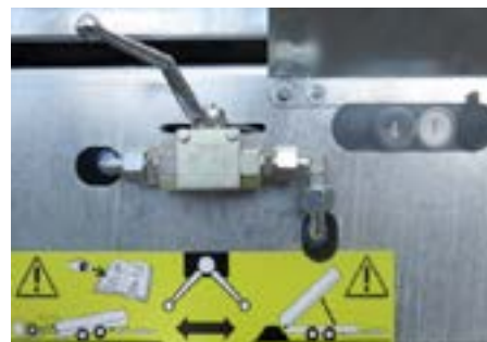
Umschalten ist ein Kinderspiel: elektro-hydraulische Steuerung und einfache Handumschaltung