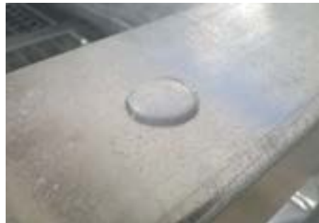
Verzinktes und passiviertes Fahrgestell, korrosionsbeständig, glänzend und wasserabweisend