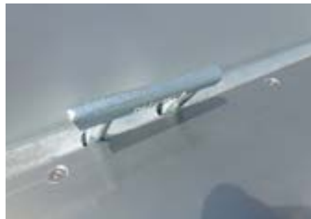
8 Anbindeösen, 2,5t, versenkt im V Profil