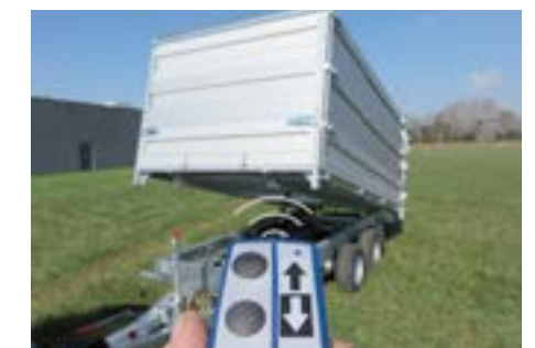
Fernbedienung für Kipper