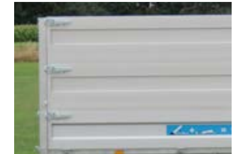
Doppelte Alu-Aufsatzbordwände (H = 2x50cm)