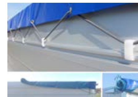
Verstärkte Flachplane oder Netz mit Aufrollhilfe und Stauplatz. (2)