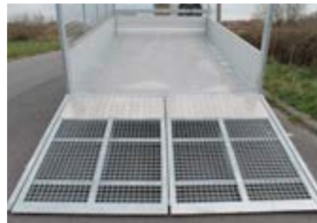
Rampe/Tür-Kombination: Drehbare Türen oder als Auffahrrampe senkbar (mit Hebehilfe)