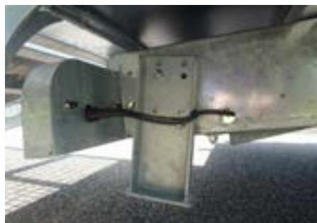
Die automatische Abstützung, dient einem schnelleren und sicheren auf- un Abladen