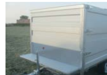
MODULA - Bordwandaufsatz klappbare Vorderwand mit 2 einschiebbaren Alu-Bordwänden (2x50cm)