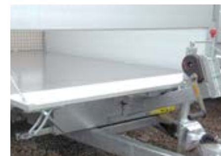
Seilwinde mit Stütze an der Vorderseite (1)