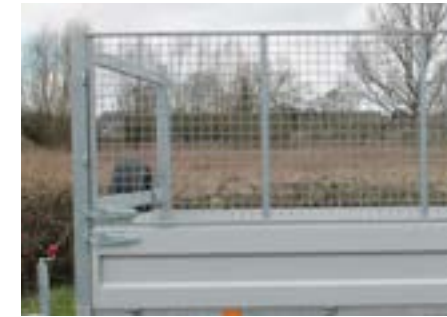
Laubgitter (H = 100cm)