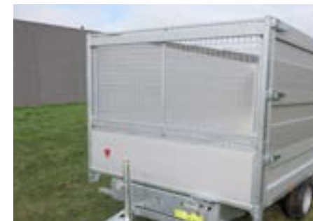
Laubgitter auf serienmäßigem H-Gestell (H = 100cm)